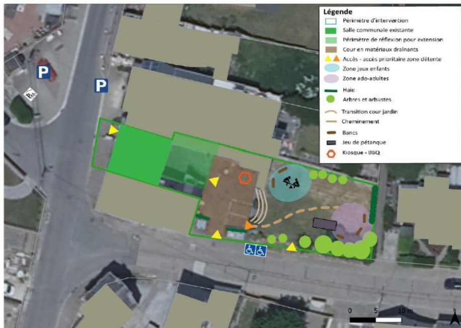
Schéma d'organisation à titre purement indicatif

et sur le financement sollicité auprès du DR